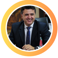
MANUEL PINHEIRO FREITAS

Procurador-Geral de Justiça do Estado do Ceará - MPCE